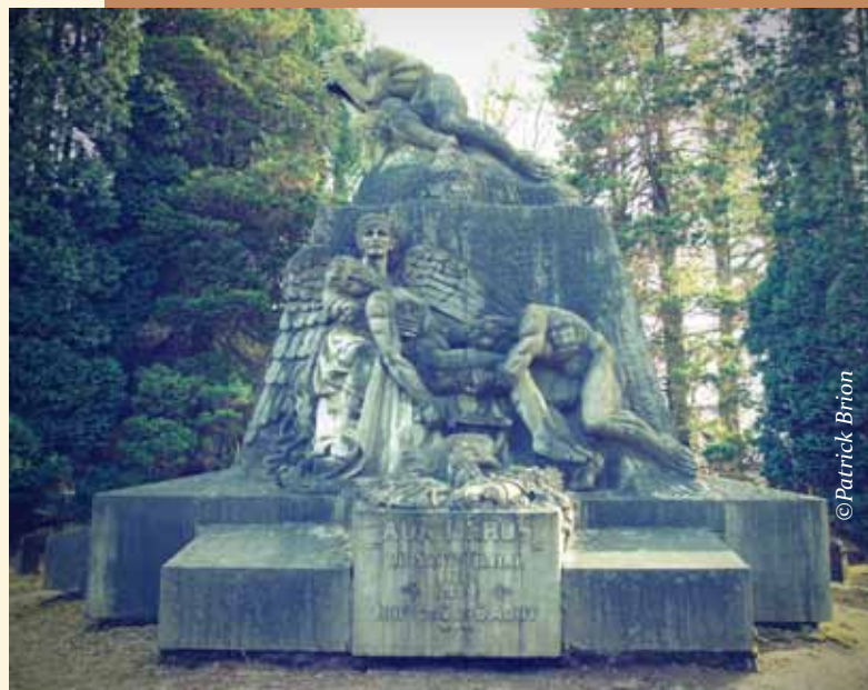
Monument voor de oorlogshelden van de nacht van 5 op 6 augustus 1914

De tekst luidt als volgt: “Dankbare herinnering aan zij die in de Eerste Wereldoorlog gevallen zijn voor vrijheid en democratie vanwege Vice-Eerste Minister en Minister van Landsverdediging Pieter De Crem”.