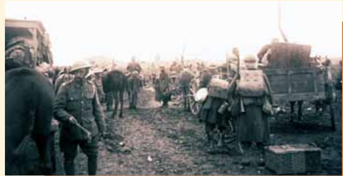
Britse en Belgische militairen tijdens het geallieerd eindoffensief.

Aan het front zelf had het Belgische leger een merkwaardige transformatie ondergaan van een 19 de -eeuws verouderd geheel naar de actieve operationele strijdmacht van 1918. Daarmee was de basis gelegd voor de moderne Belgische strijdkrachten.