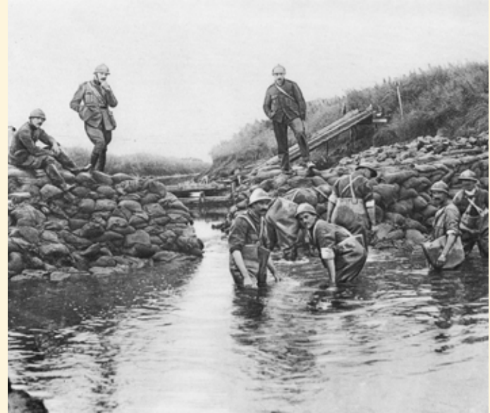
Herstellingen aan de dijken van de IJzer.

Het duurde tot 1917 vooraleer overheid en legerleiding inzag dat er meer nodig was dan nieuwe wapens en uitrusting. Er moest ook geïnvesteerd worden in training en onderwijs en de leefomstandigheden aan en achter het front waren dringend aan verbetering toe. Maar eenmaal in gang gezet, was de transformatie opmerkelijk en wierp ze snel haar vruchten af. Toen de Duitsers in het voorjaar van 1918 hun Lente-offensief lanceerden en overal aan het front grote terreinwinst boekten, kwamen ze enkel bij Merkem in de Belgische sector niet vooruit. Dat gaf een nieuw elan. In de zomer van 1918 keerden de oorlogskansen definitief in het voordeel van de geallieerden. Koning Albert I kreeg het bevel over de 'Legergroep Vlaanderen' met daarin het Belgische leger, het even grote Britse Tweede leger en twee Franse korpsen.