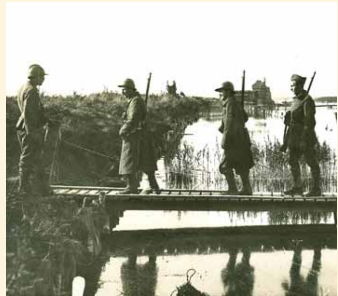
Een houten loopbrug in de overstroomde IJzervlakte.

Toch kreeg ook de Belgische soldaat aan het IJzerfront het hard te verduren, want zijn uitrusting, voeding en voorzieningen waren veel slechter dan die van de geallieerden en ook zijn soldij was slechts een fractie van wat een Britse soldaat kreeg. Aan het IJzerfront vonden dan wel geen grote