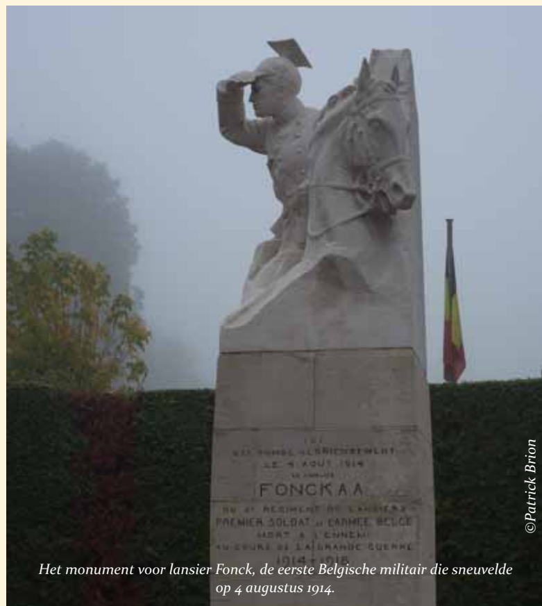
Het monument voor lansier Fonck, de eerste Belgische militair die sneuvelde op 4 augustus 1914.

Cover: Het reduit van het fort van Steendorp (bij Temse), vernietigd door het Belgische leger om niet in Duitse handen te vallen.