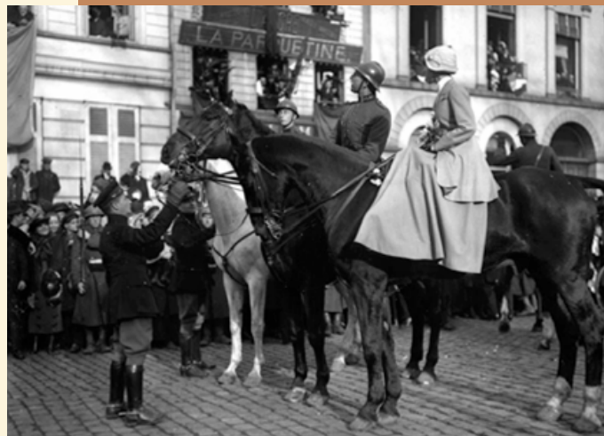
De Blijde Intrede in Brussel in '18

Deze brochure beperkt zich tot de initiatieven van Defensie voor het eerste herdenkingsjaar dat volledig in het teken staat van de rol van het Belgische leger in de Eerste Wereldoorlog.