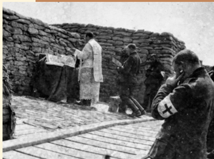
Misviering in de loopgraven.