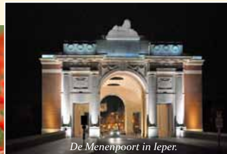
De Menenpoort in Ieper.