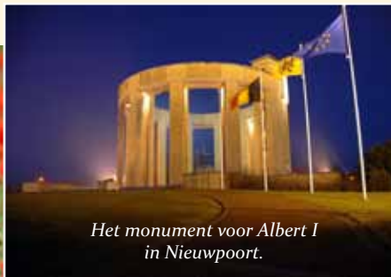
Het monument voor Albert I in Nieuwpoort.