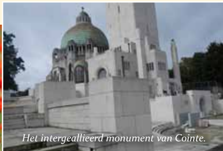
Het intergeallieerd monument van Cointe.